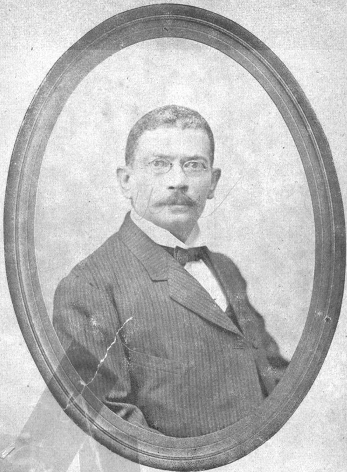
GASTON F. DELIGNE ESCRITOR Y POETA DOMINICANO.